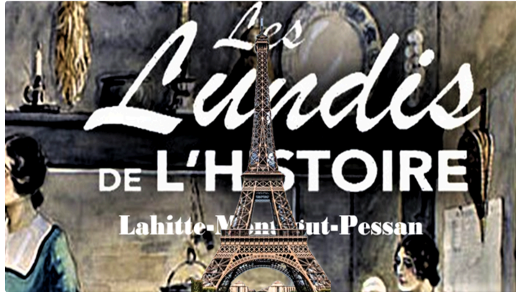
"L'histoire de la tour Eiffel" ce soir à Montégut