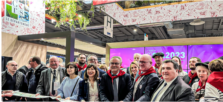
Palmarès du Floc au Concours général du Salon de l'Agriculture à Paris

Communiqué par le Comité interprofessionnel du Floc de Gascogne