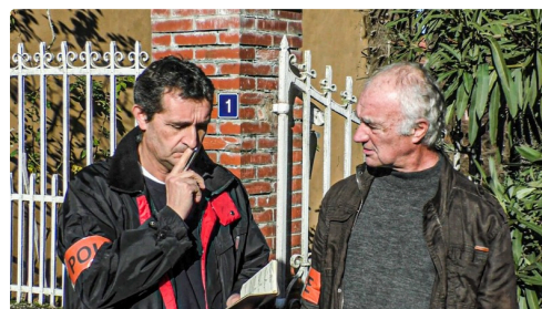
Elle est sur une piste