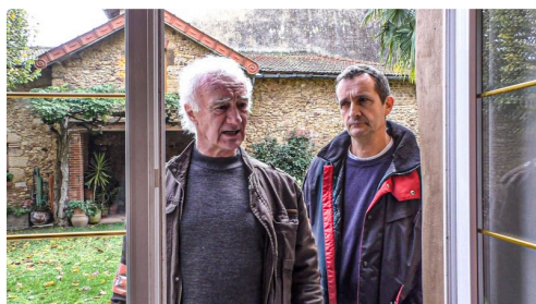
...Elle commence son enquête