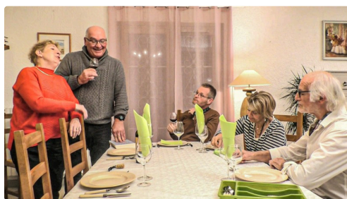
Scène de famille

N.B. - Toutes les photos ont été communiquées par Gilles Dréanic. Sur la photo du haut de page, les sapeurs-pompiers emportent le cadavre.