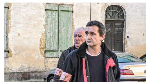
La police arrive...