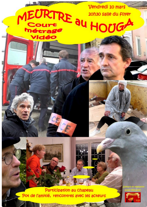
Affiche du film