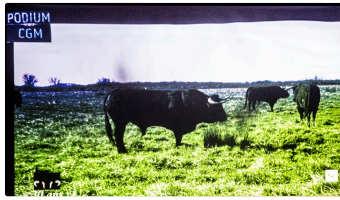
Toros de la ganaderia Pagès-Mailhan