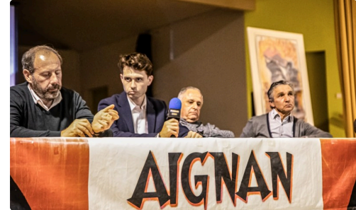
Gros plan sur la même table