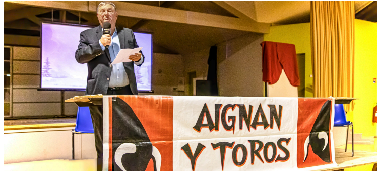
«Aignan y toros» présente ses 30èmes Pâques taurines en 2023