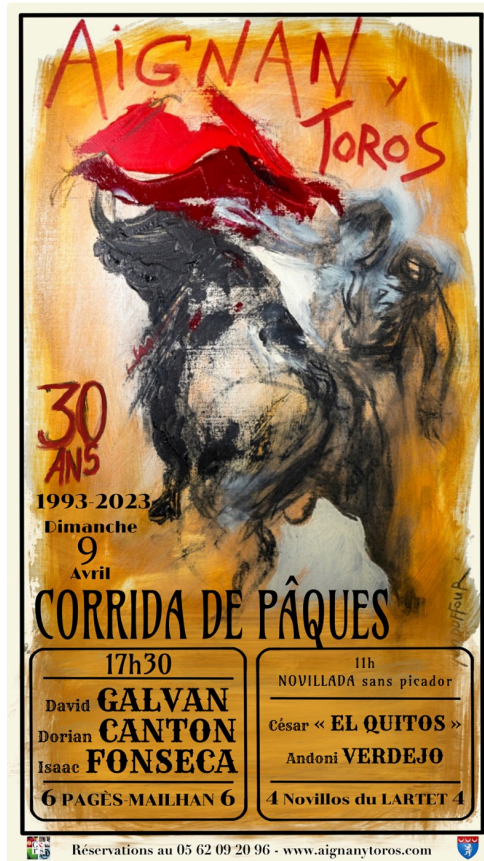
L'affiche d'Yves Duffour