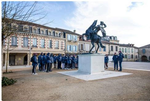
Rassemblement devant la statue équestre de d'Artagnan