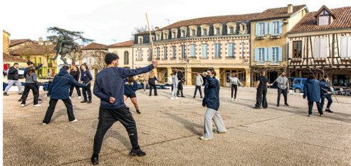
Les jeunes s'exercent au duel avec les bâtons