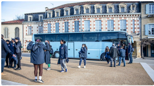
Arrivée des jeunes du SNU à Lupiac à 9 heures