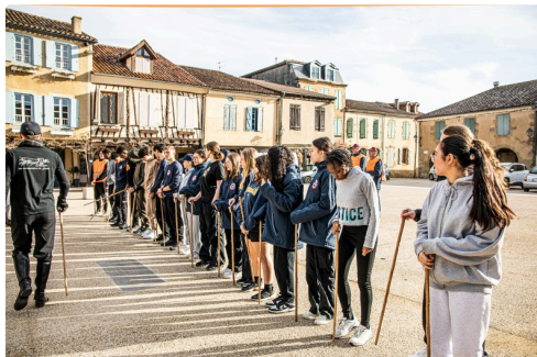
Distribution de bâtons