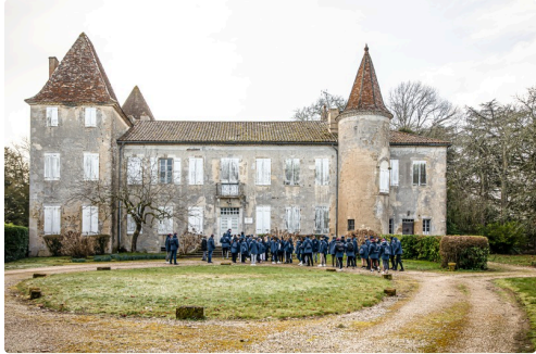
Arrivée des jeunes au château de Castelmoré