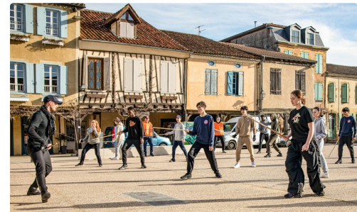
Apprentissage des gestes de base de l'escrime