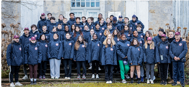
Visite historique et touristique de jeunes du Service National Universel à Lupiac

Le village, le château de d'Artagnan, le musée, plus une initiation à l'escrime