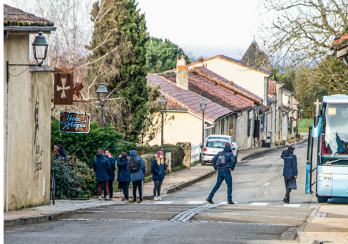
Visite du Musée d'Artagnan