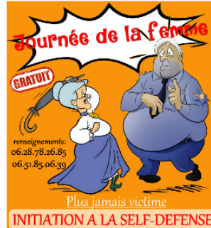
Journée de la femme : initiation à la self défense avec les Arts Martiaux Vicois

Les Arts Martiaux Vicois organisent une initiation gratuite à la self-défense dans le cadre de la journée internationale des droits de la femme qui a lieu le 8 mars