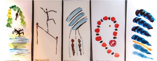
Aquarelles de Claudine Goux et poésie (© Tous droits réservés - 2022)