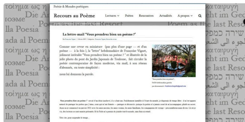
Lettre "Vous prendrez bien un poème" sur Internet