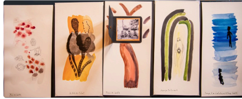
Aquarelles de Claudine Goux et poésie (© Tous droits réservés - 2022)