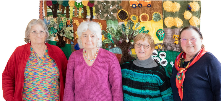
Les fées de l'aiguille de Sainte-Christie-d'Armagnac

Tricot, crochet, broderie, jacquard, elles savent tout faire