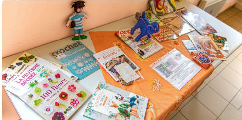
Toute une bibliothèque de modèles