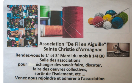
L'affiche de l'association