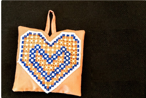
Une petite sacoche