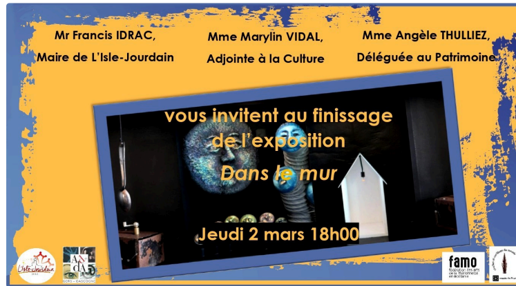
Art marionnetiques en poésie au Musée Campanaire Espace Pierre Lasserre

Une exposition pleine d'originalité, de sensibilité, le tout dans un univers poétique !