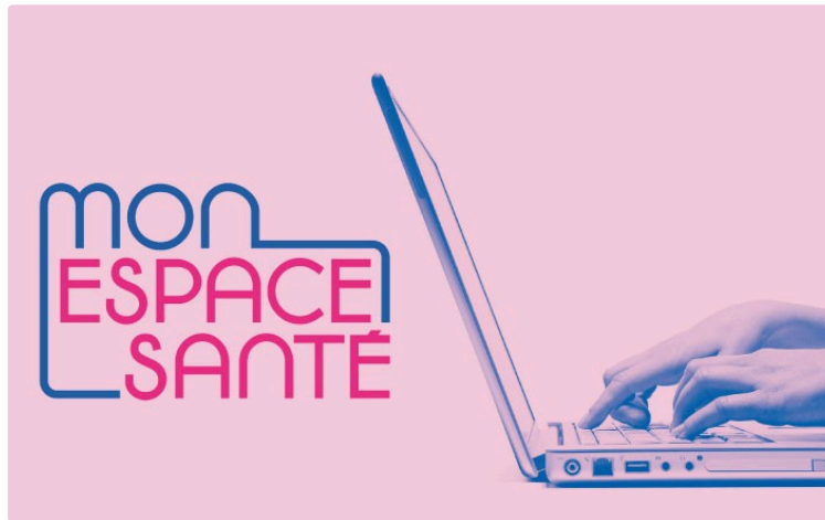
Facilitez vous le quotidien avec Mon espace santé