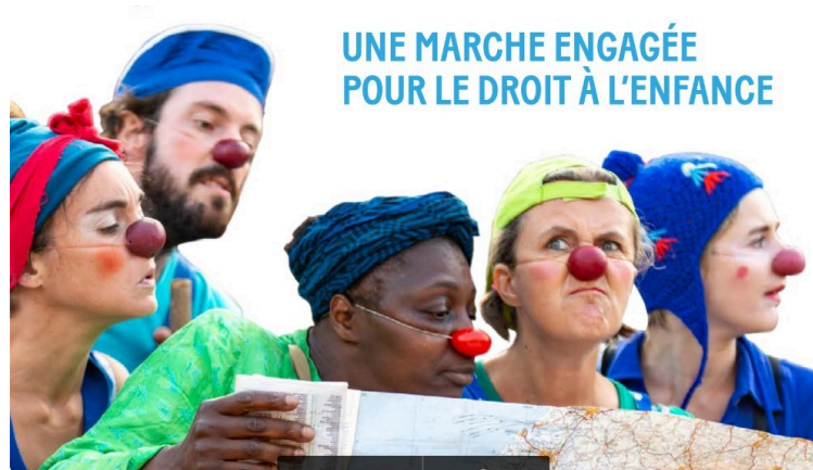
Le Gers , scène privilégiée par "LA MARCHÉ DES NEZ"