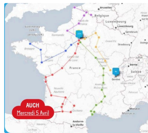
Les cinq itinéraires au départ de Toulouse, st Brieuc, Sète, Lons-le-Saunier et Calais

Une information plus complète sur le déroulé de la manifestation sera publié fin mars / début avril