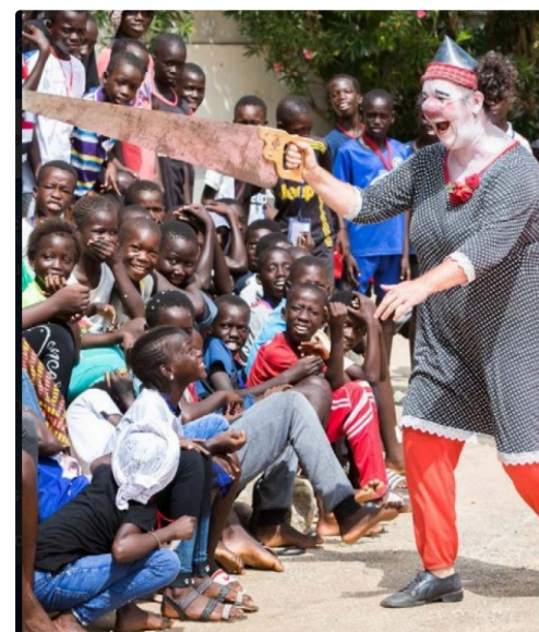
Clowns sans frontière au Sénégal avec les enfants des rues