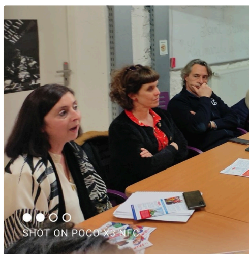
SHOT ON POCO X3 NFC