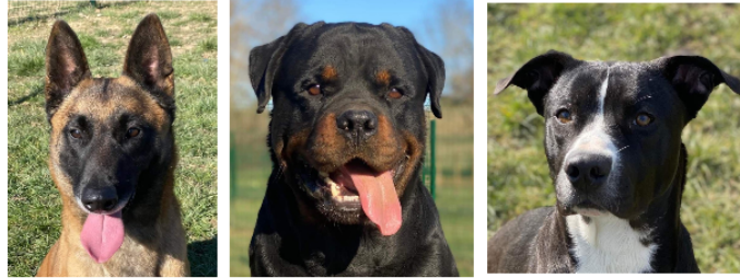
Aka, Thor et Tor, les derniers arrivés de la SPA du Gers

Cette semaine, la SPA vous présente trois nouveaux venus, la belle Aka, le puissant Tor et le coup de coeur du refuge, Thanos.