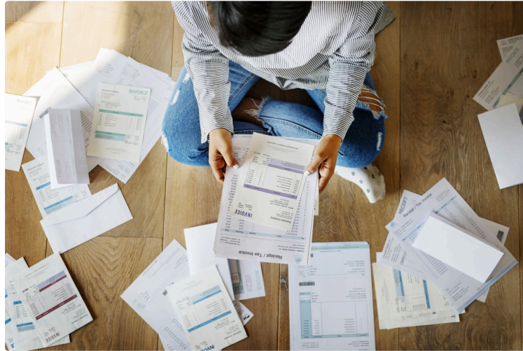
Évolution du surendettement des ménages dans le département du Gers