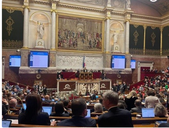
Réforme des retraites : le gouvernement recule

A 23h25, L'Assemblée nationale vient de rejeter l'article 2 sur l'index seniors. Il a été rejeté du projet de loi sur la réforme des retraites qui instaurait un index senior aux modalités inconnues, un simple élément de langage pour faire oublier l'impréparation du gouvernement sur l'enjeu de l'emploi des seniors.