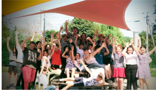
Les propositions du service jeunesse pour les vacances de février : inscrivez-vous !