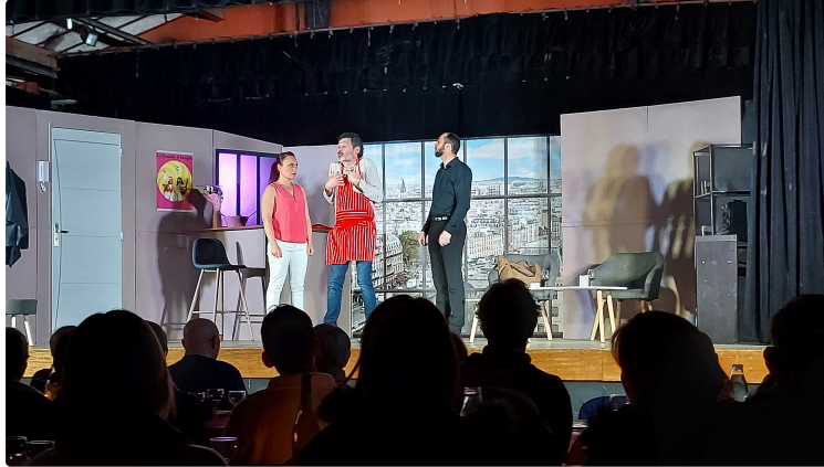
Un vaudeville moderne qui a enchanté le public samedi soir !

Le rendez-vous est maintenant bien ancré dans les habitudes vicoises : on programme longtemps à l'avance sa soirée-théâtre !