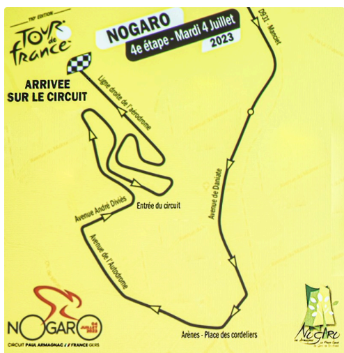
Arrivée à Nogaro le 4 juillet du Tour de France