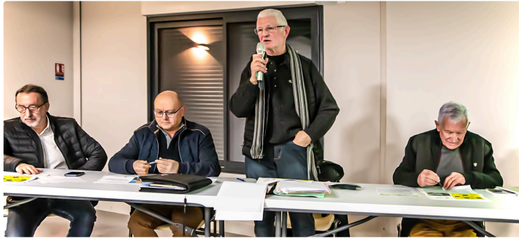
Le rêve du Tour de France devient réalité à Nogaro