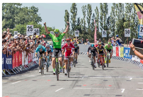
L'arrivée Route du Sud à Nogaro le 18 juin 2017