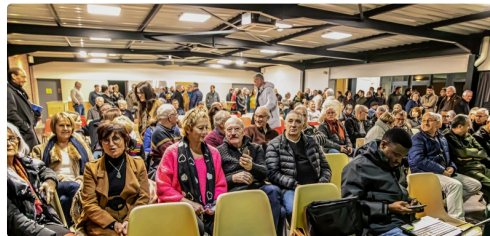
L'assistance est passionnée