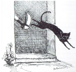
Les crêpes de la Chandeleur, exercice de haute voltige et légendes tenaces !

Février, mois des crêpes, celles de la Chandeleur et celles de Carnaval !