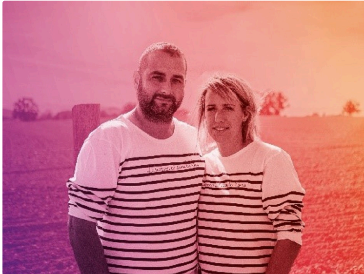
Événement : le Gers au 59 ème Salon International de l'Agriculture 2023

La 59 ème édition du Salon International de l'Agriculture et le Concours Général Agricole 2023, se tiendront du 25 février au 5 mars à Paris Expo Porte de Versailles.