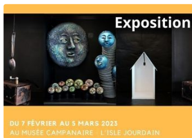
L'Actualité artistique en février présentée par l'ADDA du Gers

En ce mois de février 2023, plusieurs actions placent les arts de la marionnette et du théâtre d'objets en leur centre !