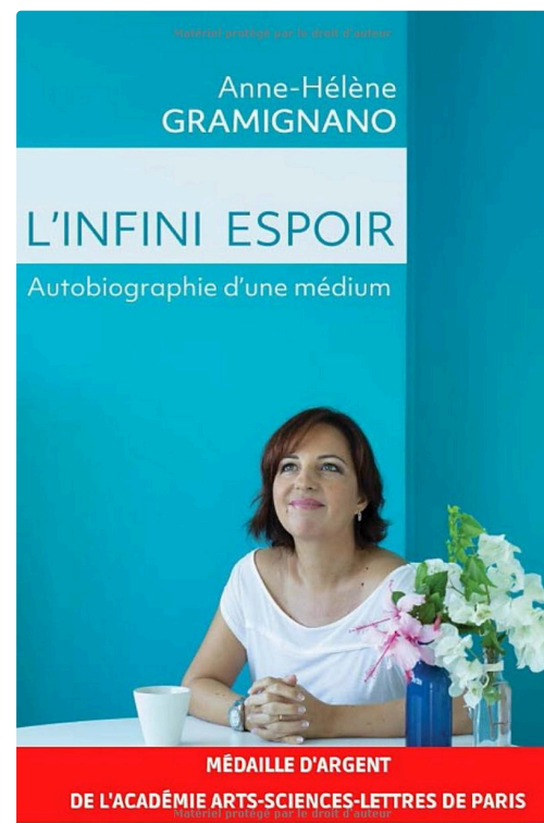
L'infini Espoir , Best-Seller.jpg