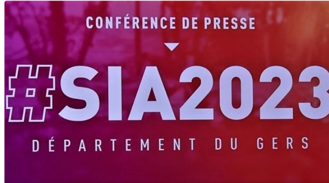
Le Gers chez lui au salon de l'agriculture