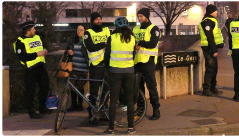
Toujours de la bonne humeur.