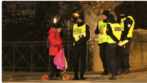
Encore de la bonne humeur.