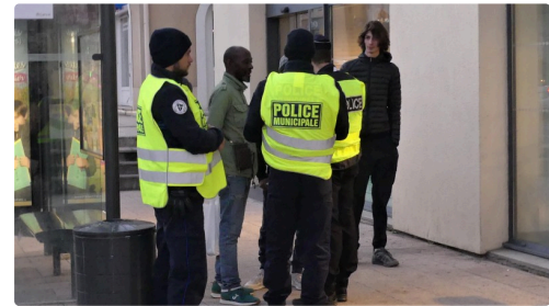
dans la bonne humeur.