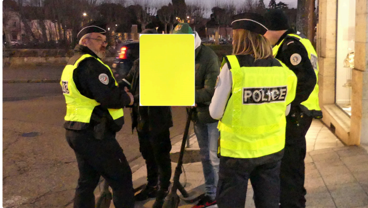
"carton jaune" pour les piétons, cyclistes et trottinettistes

Le rendez-vous était pris rue lorraine, à l'angle du boulevard sadi-carnot (aux abords du centre commercial Carrefour express) à 18h15, en présence de Mme David, directrice de cabinet ainsi que du Commissaire René Pichon pour cette "opération carton jaune" . Un carton jaune à la place d'un PV, c'est l'opération de sensibilisation que la préfecture de Gers a mis en place ponctuellement ce lundi soir et qui concerne certaines infractions au code de la route pour les piétons, les cyclistes et trottinettistes.