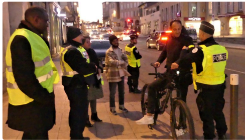
Super un brassard réfléchissant en cadeau.