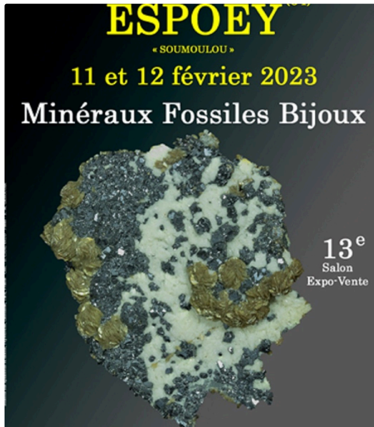
Salon des Minéraux Fossiles et Bijoux

Samedi 11 et dimanche 12 février, à la salle des fêtes d'Espoey situé à 8 km de la localité de Gardères (Hautes-Pyrénées), aura lieu la 13 e édition du salon des minéraux fossiles et bijoux .