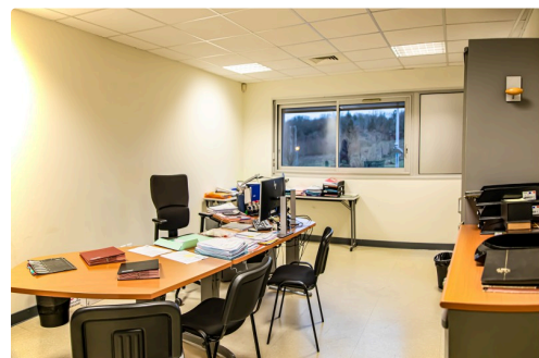
Bureau de Loïc Bombelli