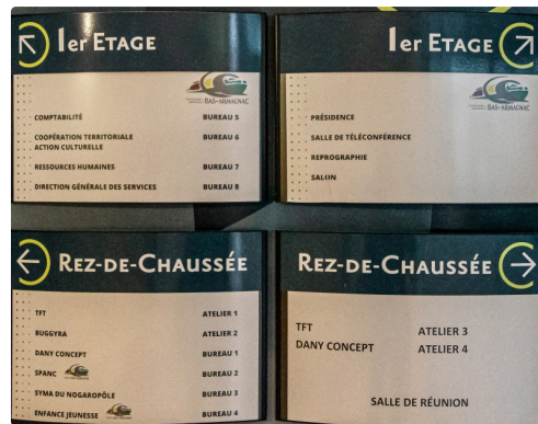
Panneau d'orientation commun pépinière - CCBA