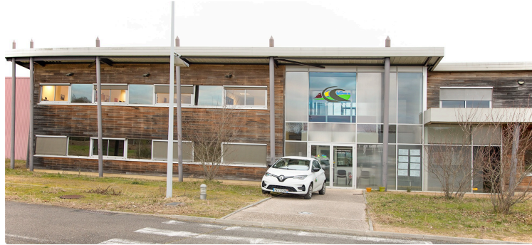
Album de la visite du nouveau siège de la CCBA à Caupenne-d'Armagnac

Dans les locaux de la pépinière du Nogaropole