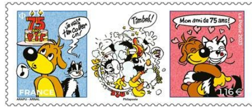
PIF : Paf sur votre courrier !

Qui se souvient du chien PIF en bande dessinée ? Il est apparu en bande dessinée en 1948. IL deviendra célèbre avec le journal PIF Gadget.