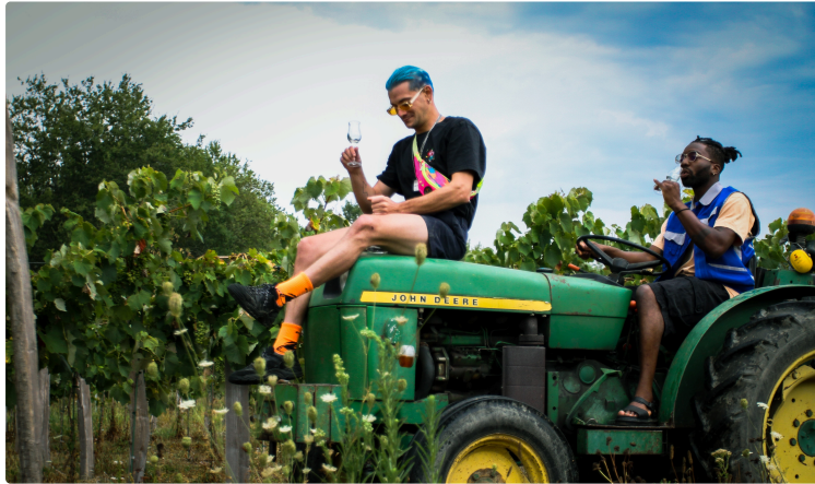
"Mixologist in the Soul" sur les traces de l'armagnac gersois !

"Mixologist in the soul" est une chaîne YouTube de reportages destinés à mettre en lumière les producteurs d'alcool et de spiritueux en vulgarisant leur production par le biais de la mixologie ( art de la création de cocktails )