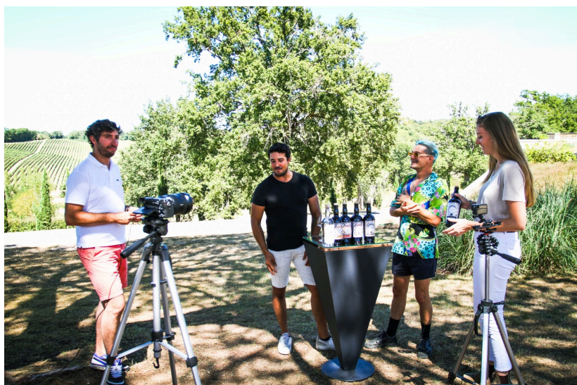
Episode Château Arton :

https://www.youtube.com/watch?v=v6cmiE2vvtI&t=189s