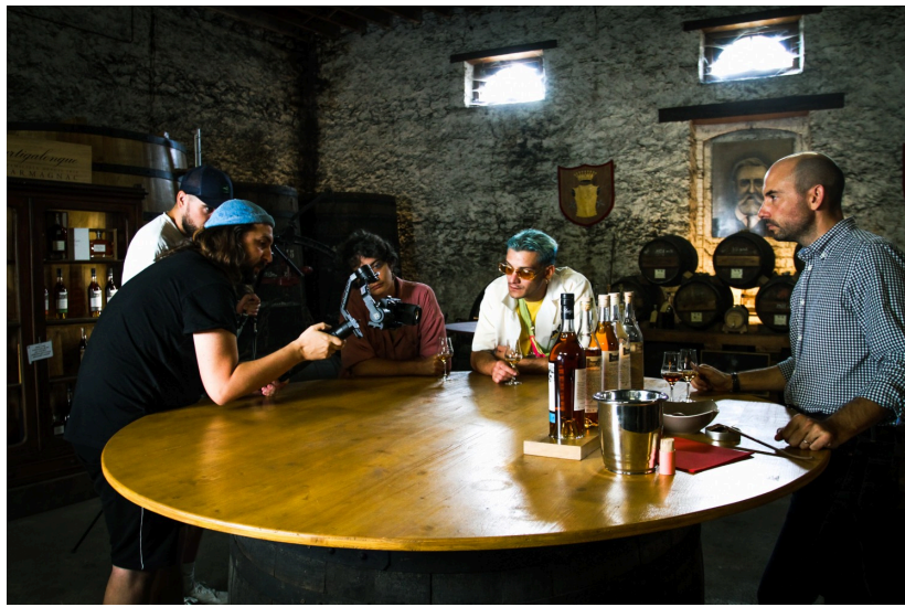
Episode Château Saint-Aubin :