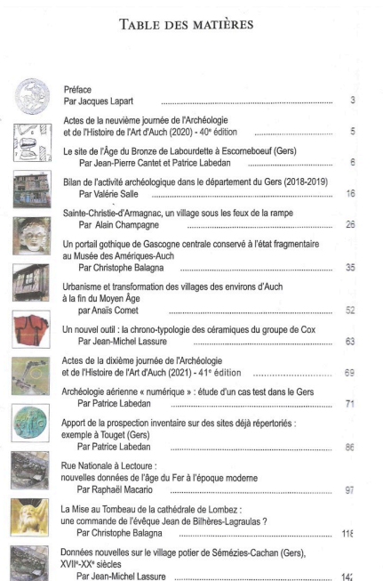
Actes 2020 2021 table des matières.jpg