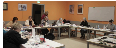
31 01 2023 atelier aquarelle 4 PAVIE.JPG