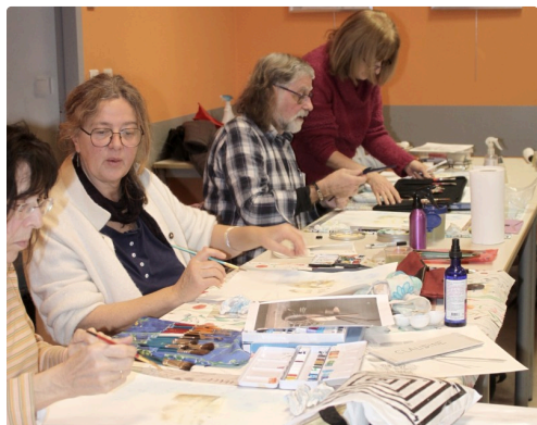
31 01 2023 atelier aquarelle 2 PAVIE.JPG