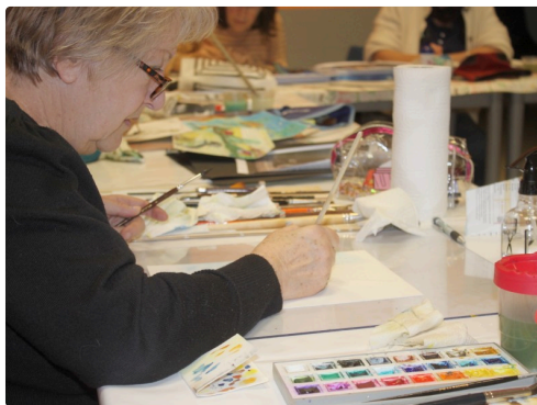
31 01 2023 atelier aquarelle PAVIE.JPG