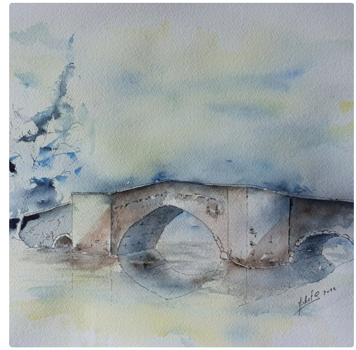
le petit pont de pierre de Pavie.jpg