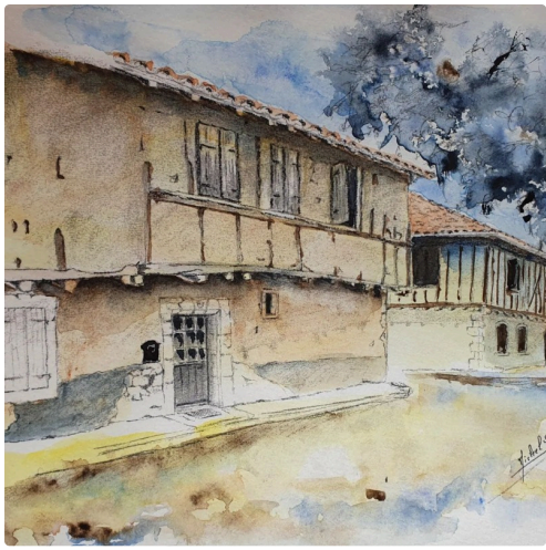
pavie M Schnur.jpg