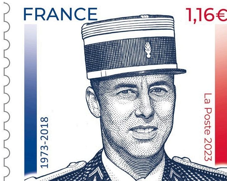
Un timbre à l'effigie du colonel Beltrame

La Gendarmerie nationale a dévoilé ce mardi un timbre postal en hommage au colonel Arnaud Beltrame, décédé en héros lors de la prise d'otage du Super U de Trèbes (Aude), le 23 mars 2018. Près de cinq ans après l'attentat de Trèbes, le souvenir d'Arnaud Beltrame est toujours présent et il sera désormais immortalisé sur un timbre. La création, réalisée l'artiste Sophie Beaujard, représente le colonel Beltrame en uniforme, sur un fond de drapeau tricolore. En ce qui concerne le timbre, il sera tiré à 705.000 exemplaires, en feuilles de 15 timbres, et sera commercialisé à compter du 27 mars prochain, soit quelques jours après la triste date de l'attaque terroriste. Ce timbre est imprimé en taille-douce (gravure en creux sur une plaque de métal). Il a une valeur faciale de 1,16 euro. Il a été imprimé par Philaposte, filiale de La Poste, dans son imprimerie de Boulazac (Dordogne).