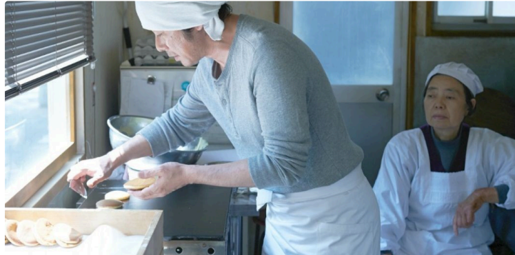
Littérature et gastronomie avec Les Mots d'Hiver, c'est ce week-end !