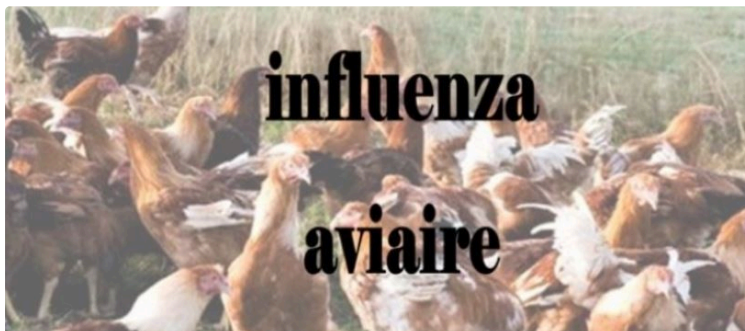
Influenza aviaire, un onzième foyer confirmé dans le Gers

Un nouveau foyer (le onzième dans le département) a été confirmé le 22 janvier par le Laboratoire National de Référence sur un élevage de la commune de AYZIEU et dépeuplé préventivement le 21 janvier. Par ailleurs une nouvelle suspicion est en cours aujourd'hui dans un élevage de poulets sur la commune de EAUZE. Le préfet du Gers a pris un arrêté redéfinissant, autour de cette suspicion une zone réglementée temporaire de 10 km bloquant les mouvements des oiseaux.