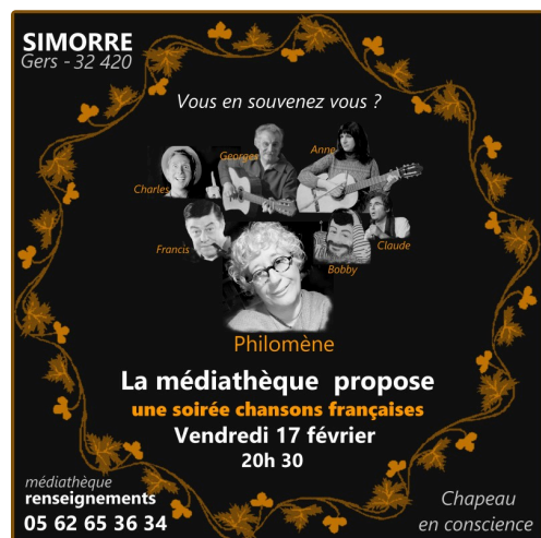
concert simorre 17 février 2023.jpg

Pour une demande de contact avec Philomène: 07 61 27 00 81.