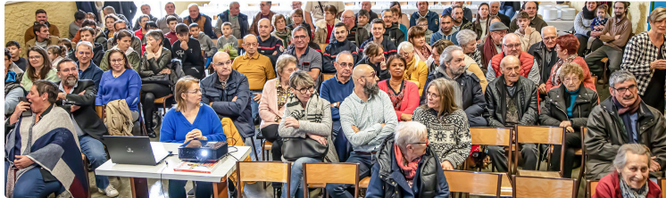
Des vœux pleins d'informations locales à Toujouse

Les anciens comme les nouveaux habitants ne peuvent rien ignorer de leur village