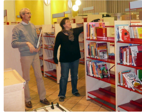
installation de la médiathèque du colisée