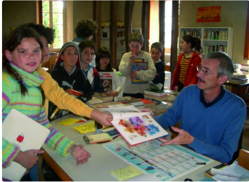
avec les jeunes