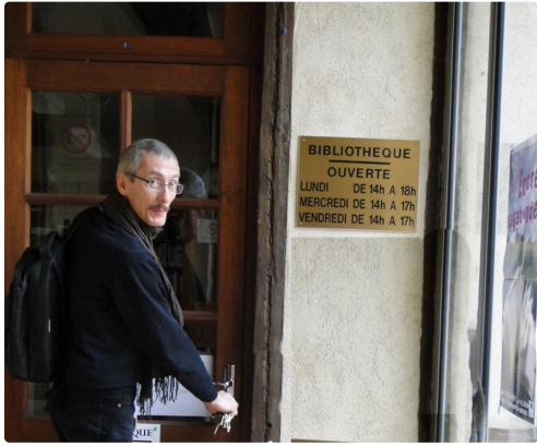
de la bibliothèque à la médiathèque