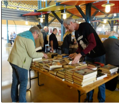
Et l'opération Troc Livres