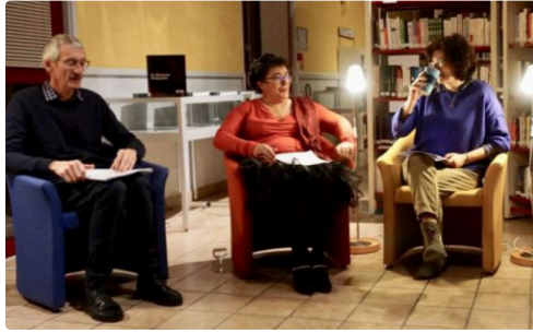
en lecteur à haute voix