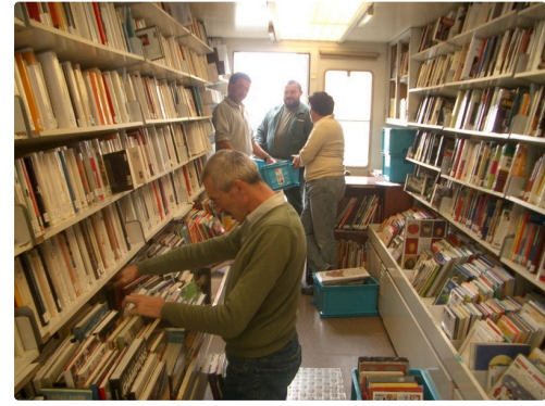
A la recherche dans le bibliobus