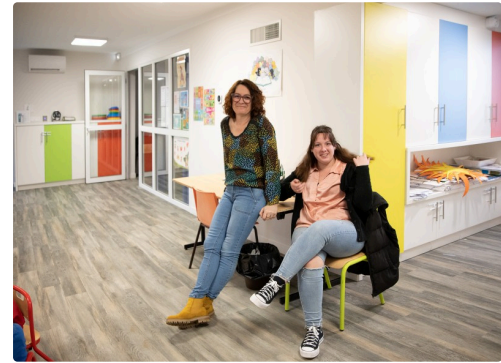
Les dames de l'Accueil de loisirs (de l'âge de la maternelle)