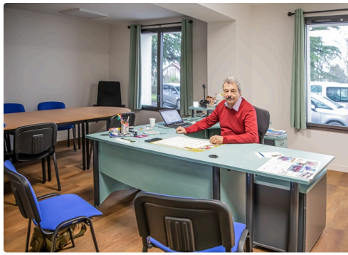
Le président à son bureau qui comporte un espace de réunion