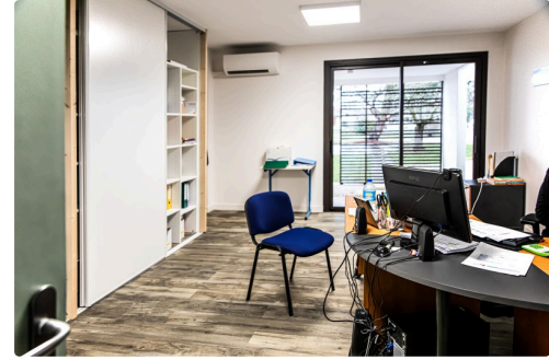
Autre exemple de bureau clair et spacieux