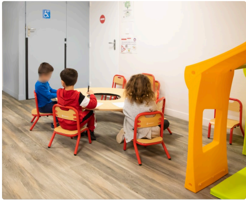
Coin de dessin de l'Accueil de loisir