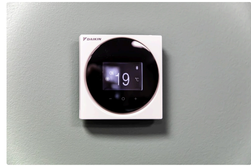
Le bâtiment est chauffé à 19°