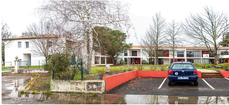
Le Journal du Gers visite le bâtiment de la CC Armagnac-Adour à Riscle

Des locaux spacieux, clairs et fonctionnels