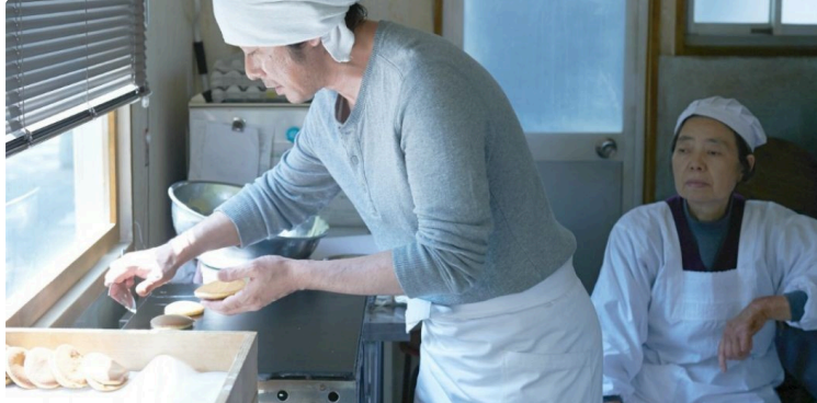
"Les Mots d'Hiver " revient avec le thème "Littérature et gastronomie"

Après deux ans d'absence pour cause de Covid, les Mots d'Hiver reviennent le dernier week-end de janvier.