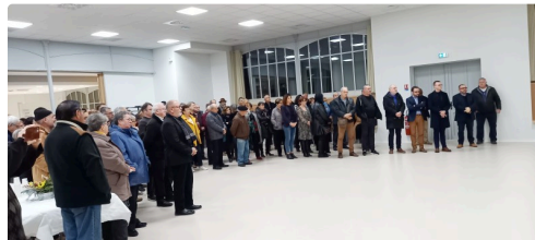
De nombreux seissanais ont assisté à l'inauguration de la salle des fêtes.