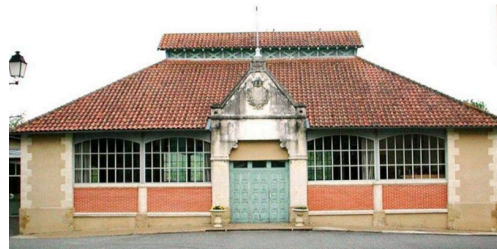
L'aspect extérieur du bâtiment a été respecté.