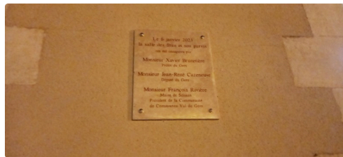
La plaque de l'inauguration.