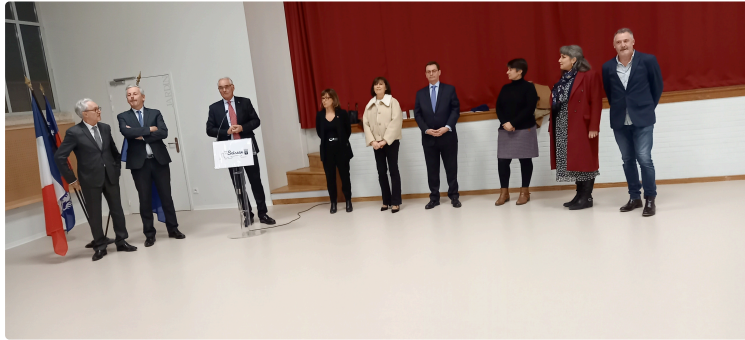
La rénovation de la salle des fêtes a respecté le bâti ancien et le moderne

L'inauguration a eu lieu en présence du préfet du Gers le vendredi 6 janvier