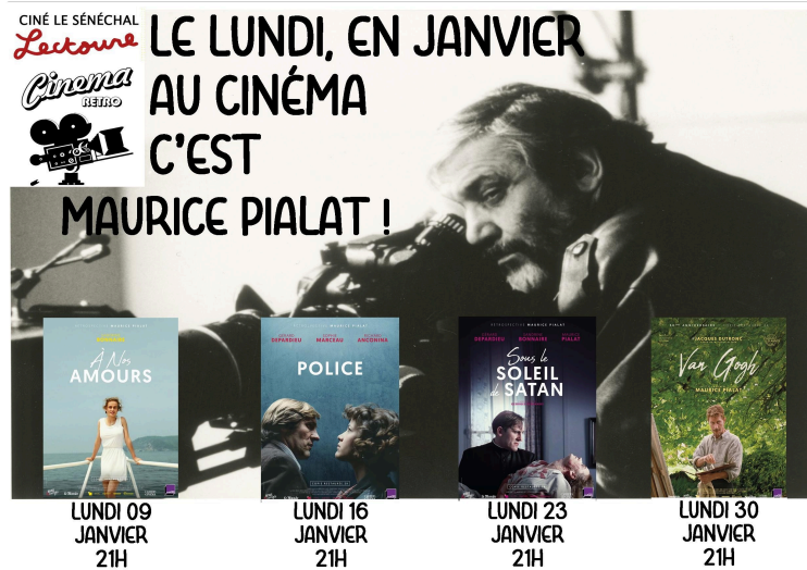
Programme de votre cinéma: le lundi, en janvier, un cycle consacré à l'oeuvre de Maurice Pialat

La carte d'adhérent 2023 est disponible depuis le mercredi 4 janvier 2023. Elle est cette année individuelle et nominative, au tarif unique de 12 €. Elle vous permet d'obtenir le tarif préférentiel de 5 € toute l'année.