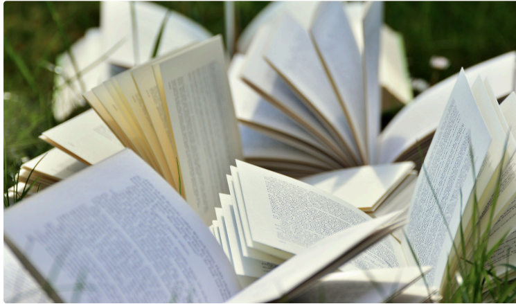
Ecrivains gascons, à vos plumes !

La Société archéologique du Gers organise cette année encore le Prix Pierre-Dumont, d'un montant de 300€.