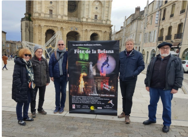
La Befana, sorcière bien aimée au physique disgracieux , fait son grand retour