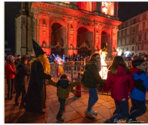
farandole autour du pignarul