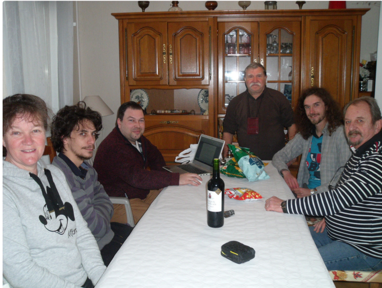
"Les Ogres Noirs", le projet d'un court métrage se précise

L'association a pour but de retracer un film sur la résistance dans le Gers