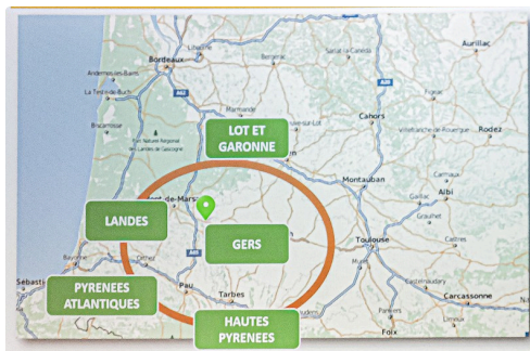
Territoire d'intervention du GE 4 Saisons (document projeté par Coralie Dauphinot)