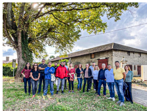
Demandeurs d'emploi, partenaires et GE 4 Saisons à Malartic