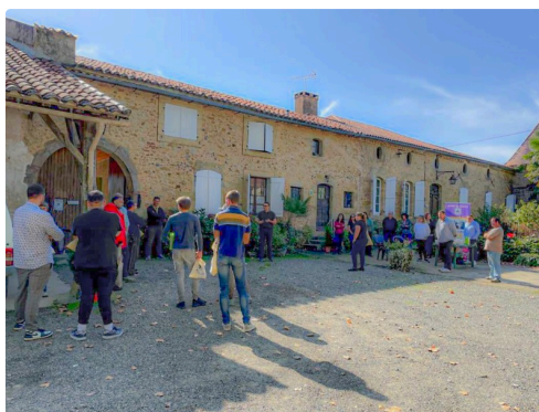
Idem au Domaine Malartic