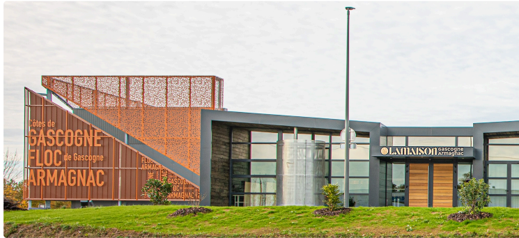
Syndicat et Interprofession des vins Côtes de Gascogne: un ensemble bien organisé

L'assemblée générale les décrit en profondeur