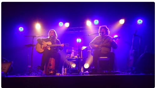
Spectacle de Théâtre