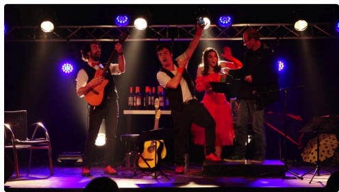
Spectacle de Théâtre