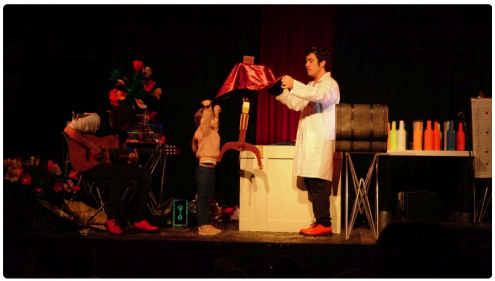
Spectacle de Théâtre