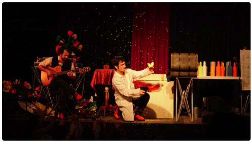
Spectacle de Théâtre