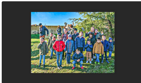
Les enfants