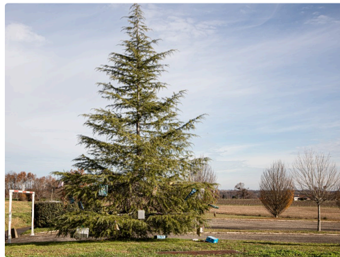
Le sapin à côté de la mairie de Bourrouillan