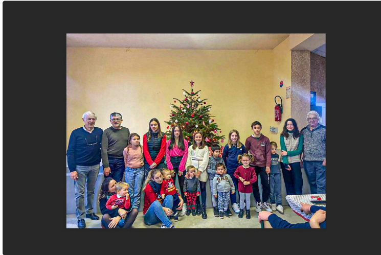
Les habitants de Loussous-Débat se retrouvent en attendant Noël

Pour un goûter avec une vingtaine d'enfants et une dizaine de seniors