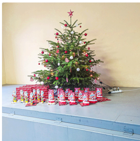
L'arbre de Noël et les cadeaux