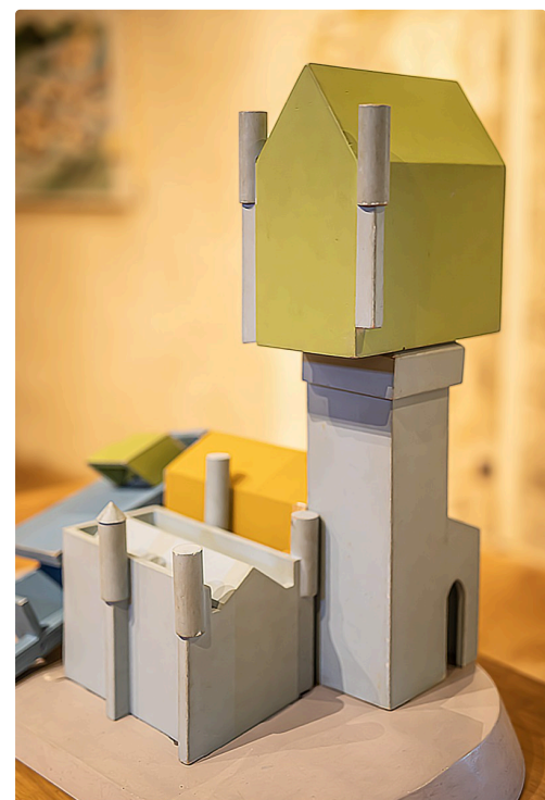
Un château-fort sens dessus dessous