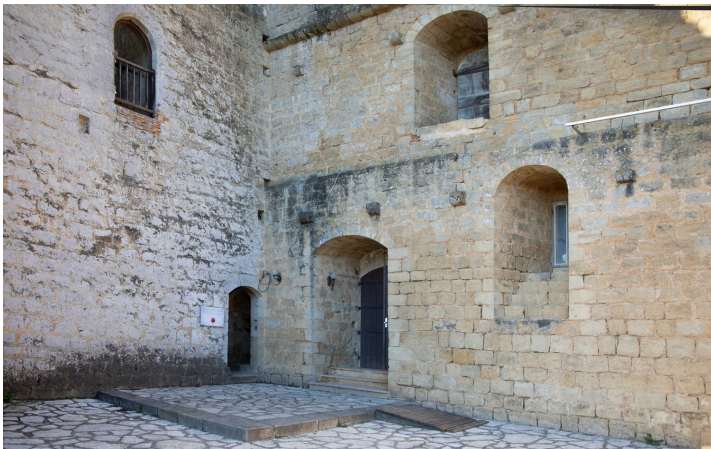
Entrée de la Tour

Et il y a beaucoup de choses à voir et à entendre dans ce Musée totalement refondu depuis deux ans. Et il n'est pas encore fini !