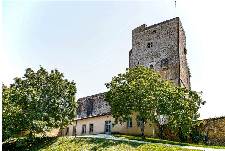
Noël commence à la Tour de Termes-d'Armagnac !

Chaque jour, des enfants y construisent leur château-fort