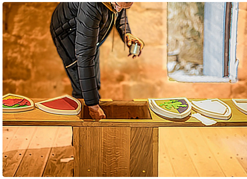
Coin de l'héraldique : création de blasons en bois