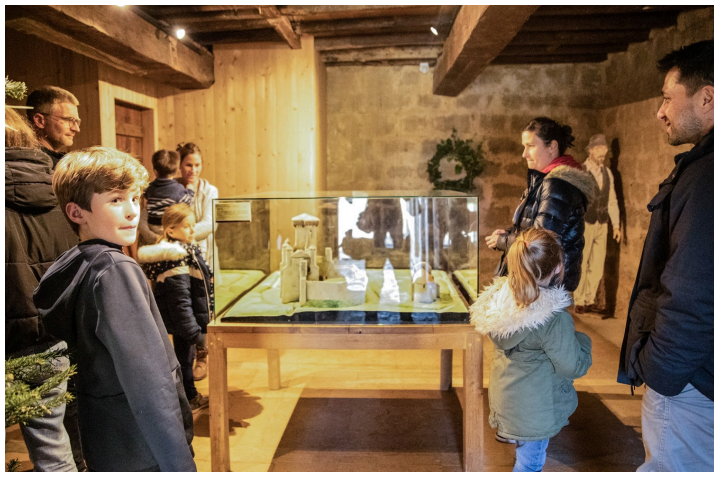
Début de la visite au rez-de-chaussée