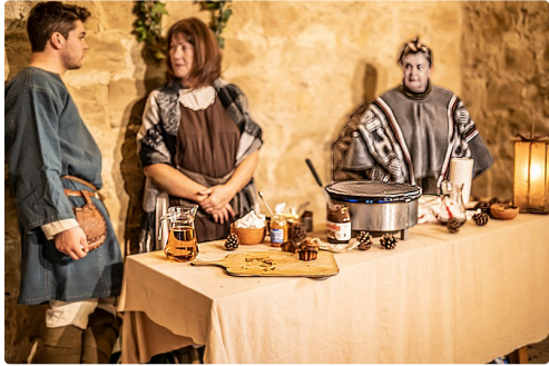
Crêpes, chocolat chaud et autres boissons