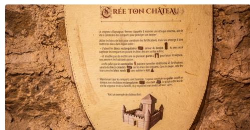
"Crée ton château-fort !"