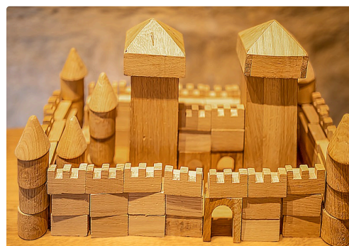
Un château-fort récemment construit