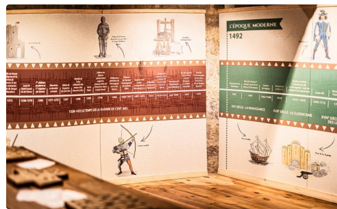
Suite des Repères historiques