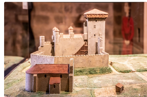
Maquette du château de Termes reconstitué