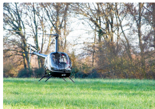
L'hélico se pose