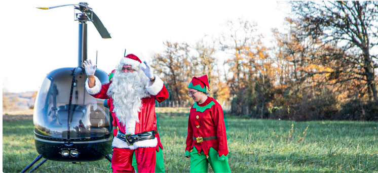
Cette année, le Père Noël arrive à Sorbets en hélico!