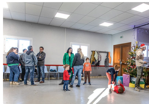
Les premiers Sorbetziens arrivent au foyer

Mais il reste une question : en quel équipage le Père Noël arrivera-t-il l'année prochaine ?