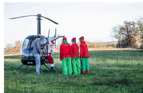
Le Père Noël débarque accueilli par les lutins