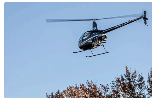
L'hélico du Père Noël est en vue