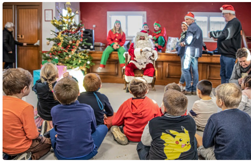
Le Père Noël distribue les cadeaux aux enfants