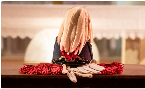
2 Casoar, shako, épaulettes et gants de Saint-Cyrien