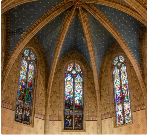
Le vitraux du chœur de l'église Sainte-Marie