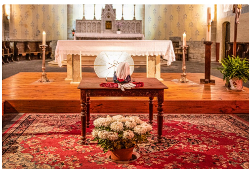
Au-revoir au casoar