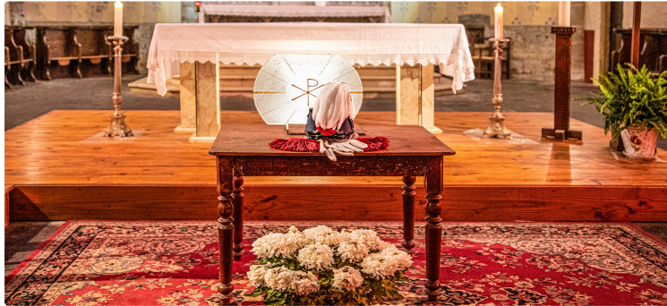
Les Saint-Cyriens du Gers se retrouvent à Bassoues

Pour la tradition du «2 S», anniversaire d'Austerlitz