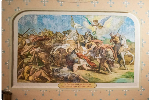
Tableau de la mort de Saint Fris dans l'église Sainte-Marie