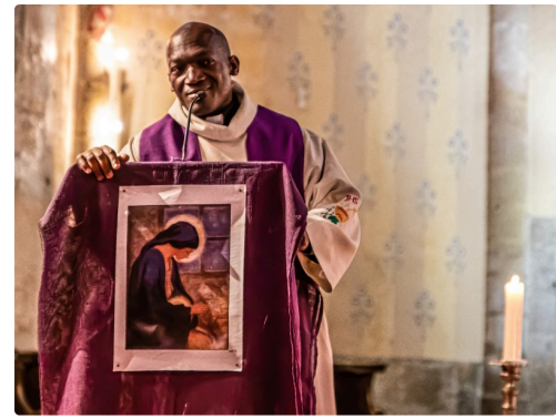
Le curé de Mirande, prêtre Pallotin, semble surpris que des militaires soient chrétiens...